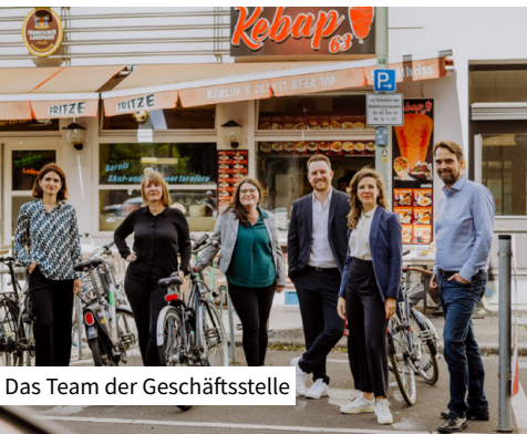
Das Team der Geschäftsstelle

Die bcsd bekennt sich zum Bild der europäischen Stadt, die mit ihrer lebendigen und multifunktionalen Innenstadt Bürger:innen und Gäste gleichermaßen anzieht und sie zum Aufenthalt einlädt. Die bcsd stärkt die Entwicklung des Stadtmarketings, erkennt neue Fragestellungen, bietet Expertise und schafft Netzwerke für die Diskussion um die Stadt der Zukunft. Wir freuen uns, wenn Sie Teil davon werden!