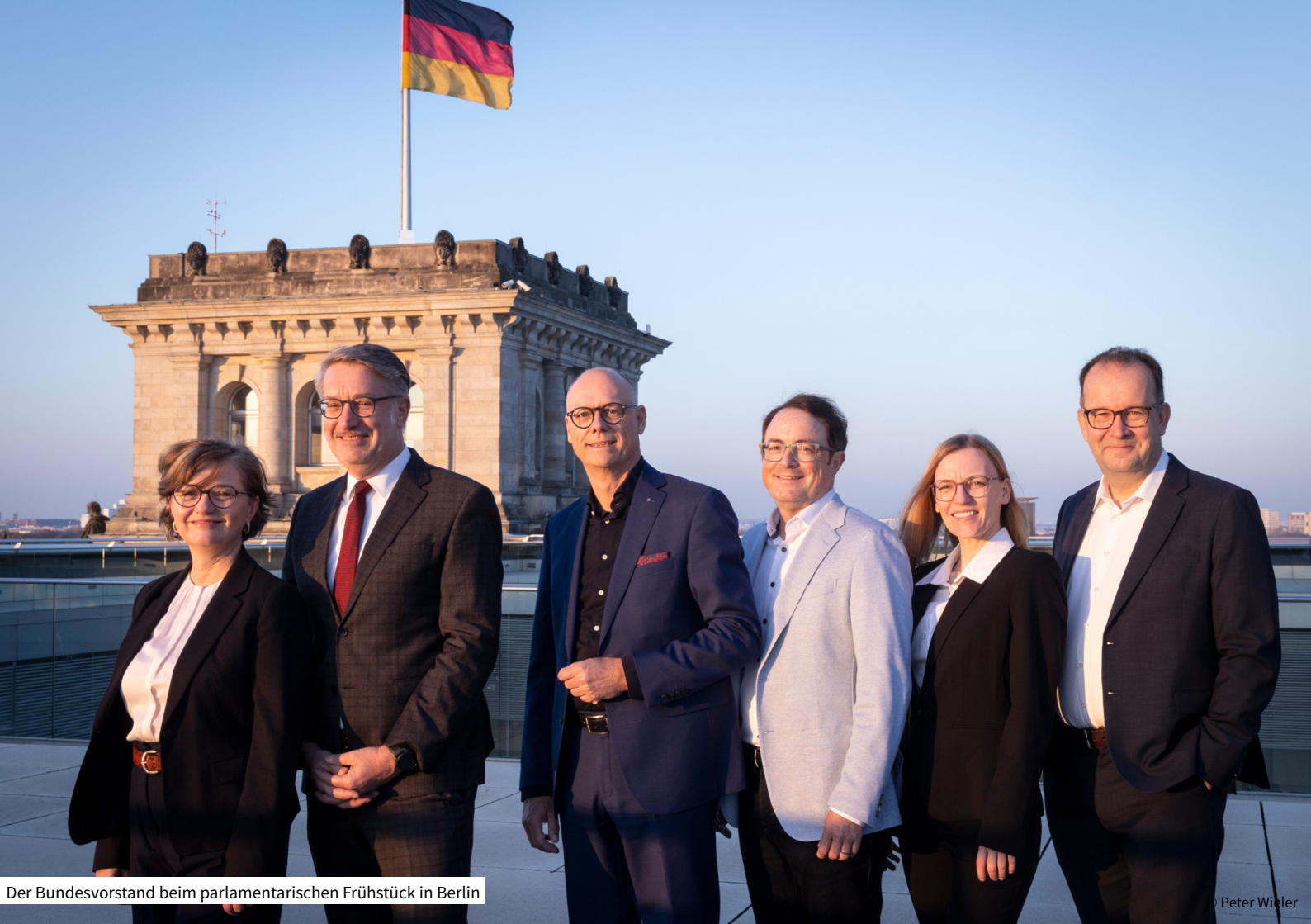
Der Bundesvorstand beim parlamentarischen Frühstück in Berlin