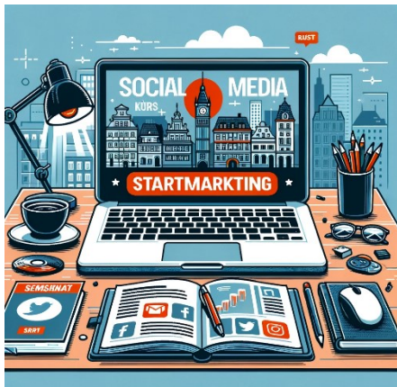
Erstellt mit Unterstützung von ChatGPT

In unserer sich rasant digitalisierenden Welt hat die Präsenz in den sozialen Medien für das Stadtmarketing längst an Relevanz gewonnen. Kanäle wie Instagram oder LinkedIn sind nicht mehr nur Orte für private Interaktionen, sondern haben sich zu mächtigen Plattformen entwickelt, mit denen eine breite Zielgruppe effizient und zielgerichtet angesprochen werden kann. Für Stadtmarketing-Verantwortliche bedeutet dies, dass sie nicht nur Informationen verbreiten, sondern auch direkt mit Menschen und Unternehmen interagieren und wertvolles Feedback erhalten können. Durch die Beobachtung von Trends und Diskussionen in sozialen Netzwerken können sie schnell auf die Bedürfnisse und Wünsche ihrer Zielgruppen reagieren und ihre Strategien entsprechend anpassen. Gerade in