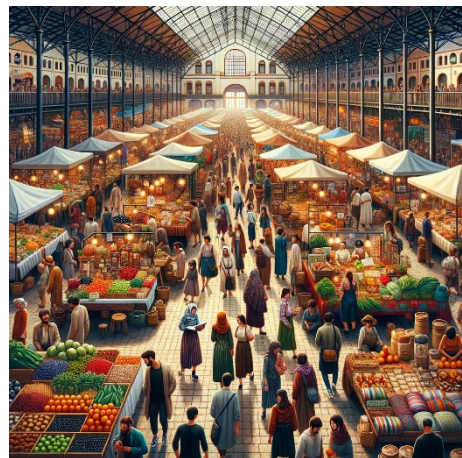
Erstellt mit Unterstützung von ChatGPT

Was sind die aktuellen Trends und standortabhängige Erfolgsfaktoren bezüglich der Markthallen in Deutschland? Dieser Fragen haben sich die BBE Handelsberatung GmbH und IPH Handelsimmobilien in einer aktuellen Studie gewidmet und die Ergebnisse in einem Whitepaper veröffentlicht. Auf Grundlage der Analyse von 30 Markthallen wurde dabei eine Einteilung in drei Cluster vorgenommen: Die klassische Markthalle, Hallen mit einem Fokus auf Gastronomie und gemischte Hallen. Eine weitere Kategorisierung erfolgte nach Parametern wie Lage, Größe, Einwohnerzahl, Wirtschaftskraft und Verkehrsanbindung. Mit der Studie möchten die Initiatoren dazu beitragen, nachhaltige Ansätze für die Positionierung von Markthallen zu entwickeln und ihr Potenzial für die Städte weiter auszuschöpfen. Die Studie finden Sie hier .